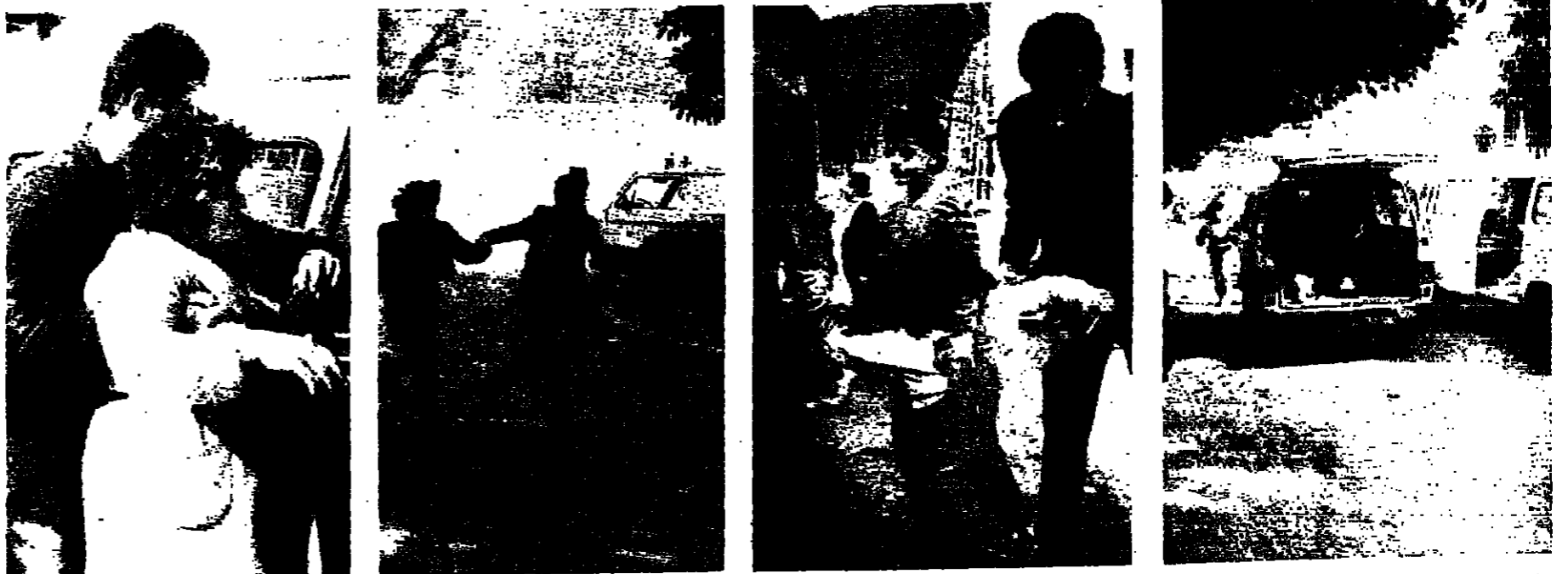
المسجون أثناء تفحص بعد انفجار السيارة المفخومة في طرابلس